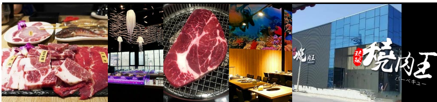
高優質燒肉王冷氣無煙燒烤吃到飽 >> 加購價 550 元 (海鮮、五花牛、霜降牛、生蠔、熱食、冰等吃到飽)