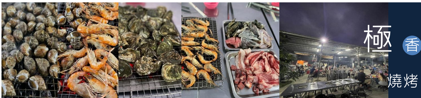
金獅子海景 BBQ 吃到飽 >> 加購價 400 元 (蝦、生蚶、肉類、熱食、冰淇淋等吃到飽)